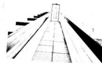
tunel k operační místnosti